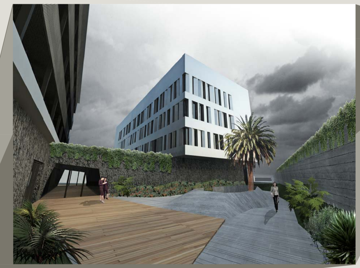
Imagen: Patio posterior del edificio, accesos garaje.