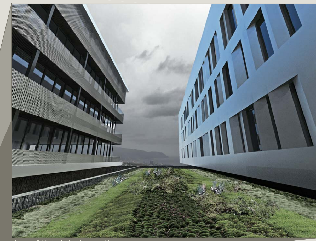
Imagen: Cubierta ajardinada entre módulos