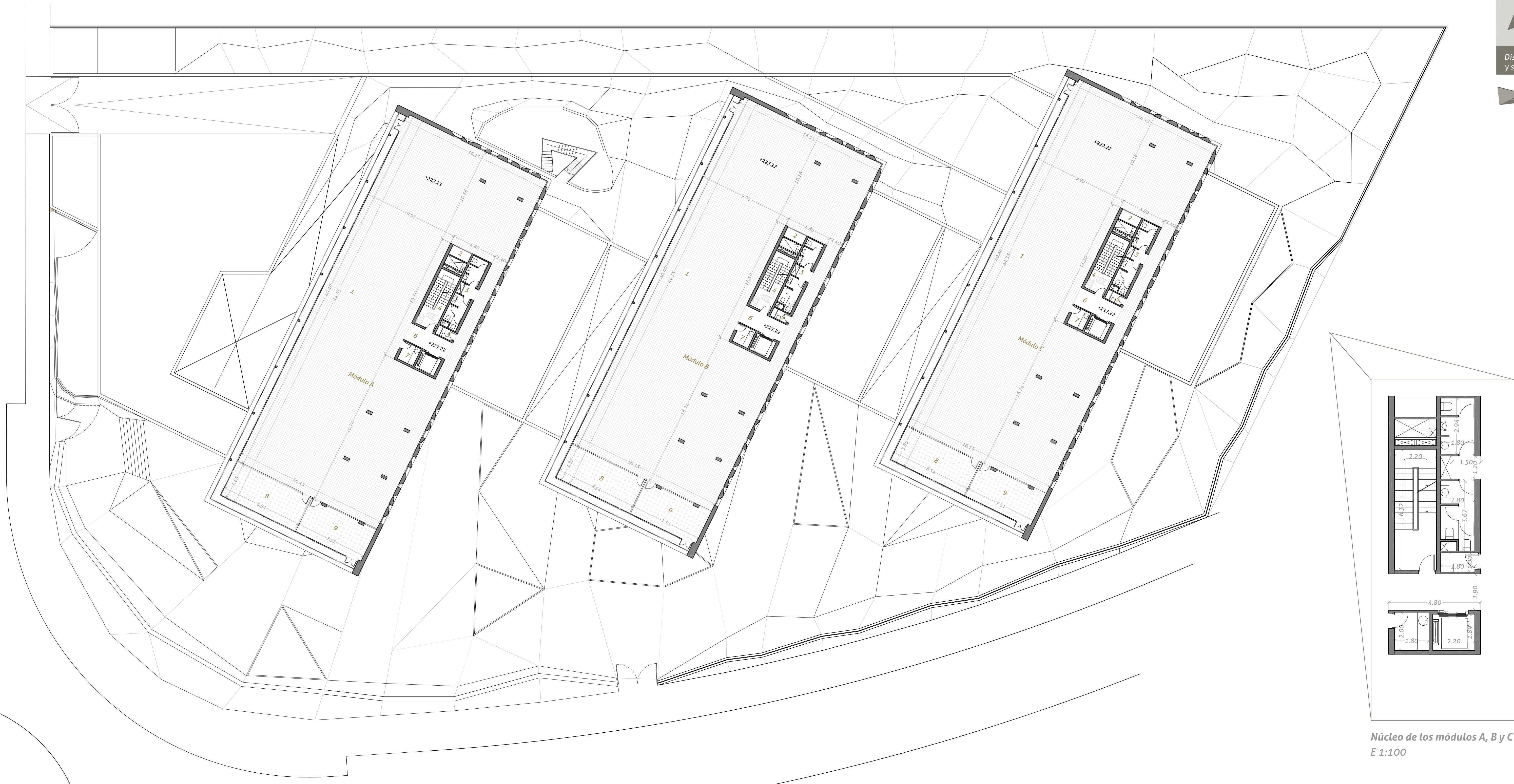
Núcleo de los módulos A, B y C E 1:100

SUPERFICIE ÚTIL planta +1 2279.37 m 2 SUPERFICIE CONSTRUIDA planta +1 2432.19 m 2