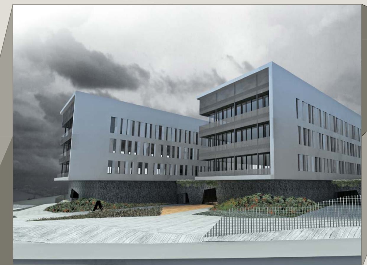
Imagen: Lateral módulos A y B.